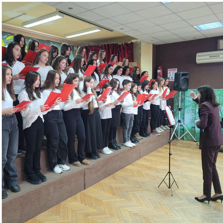
Дан школе, приредба

Ту децу и данас видим у нашем школском хору. Децу која су срећна што су ту, која желе да буду ту и којој је највећа радост кад добију аплауз од публике за свој труд. А мени, њиховој наставници, њихов осмех и истинска срећа и задовољство на њиховим лицима.