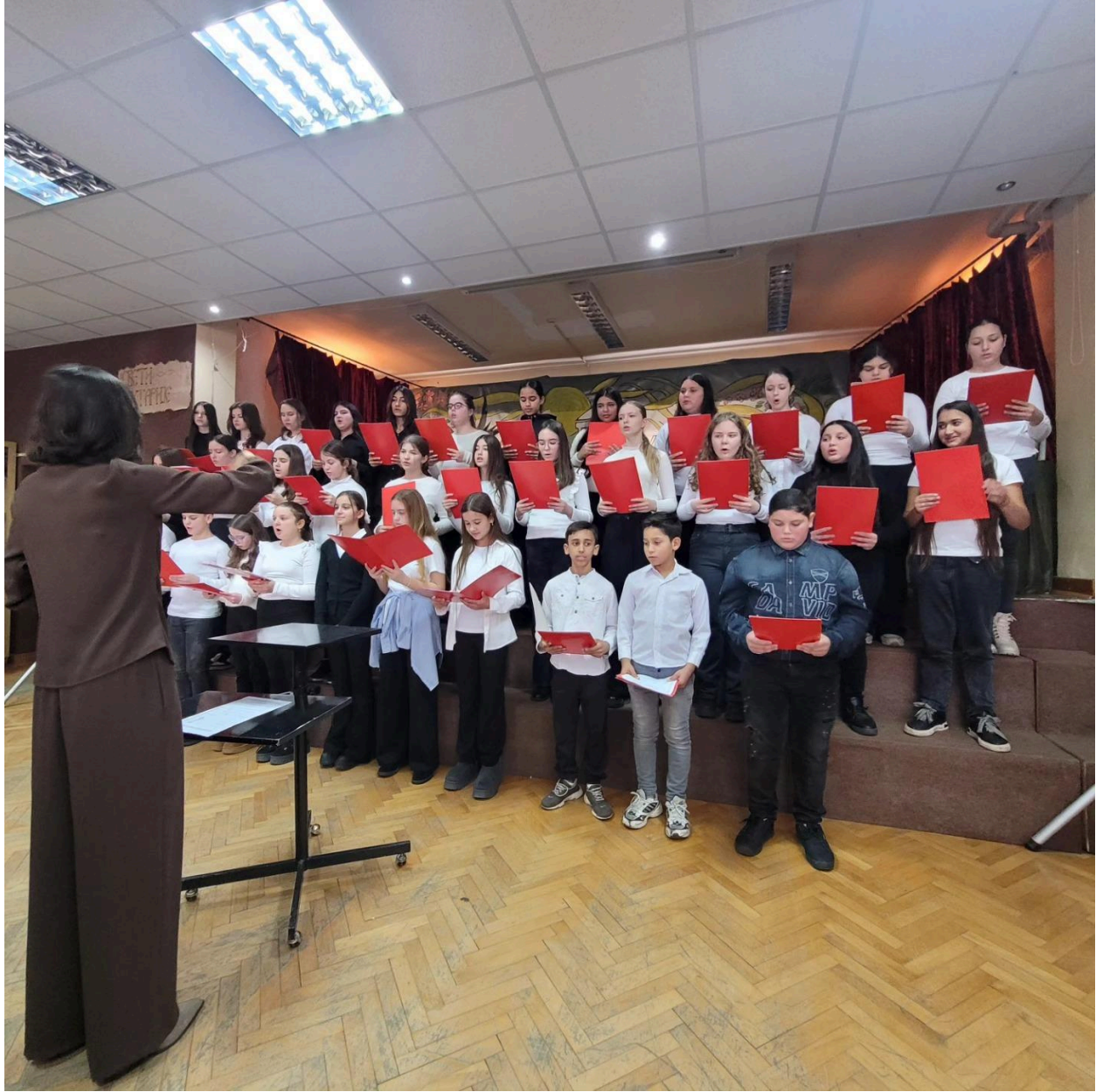
-Наступ хора на приредби школске славе